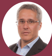
» Raffaele Piria adelphi